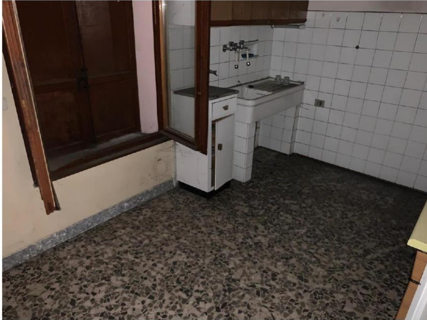
Cucina Piano Primo