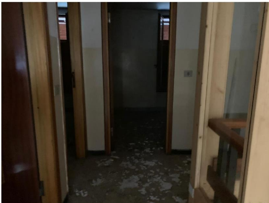
Ingresso Piano Primo