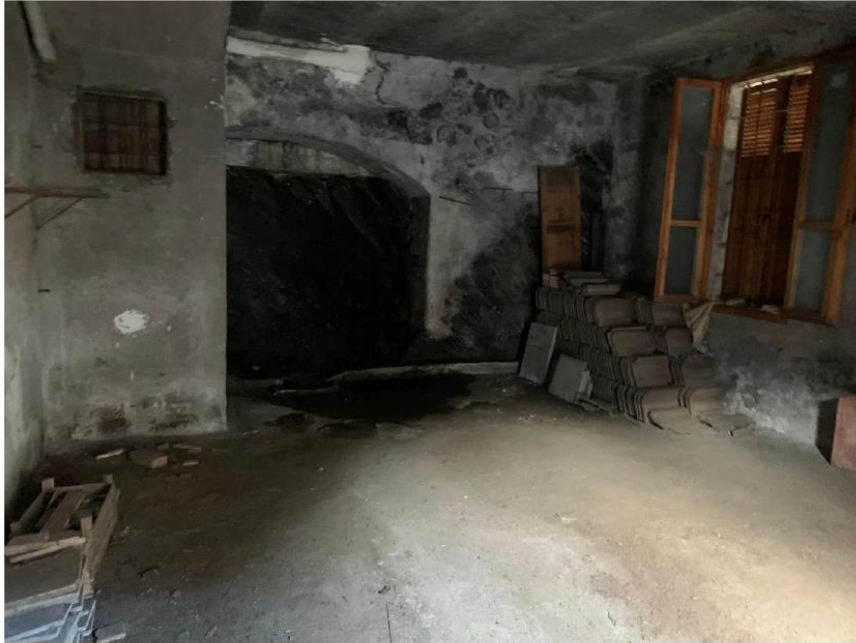
Ripostiglio Piano Terra