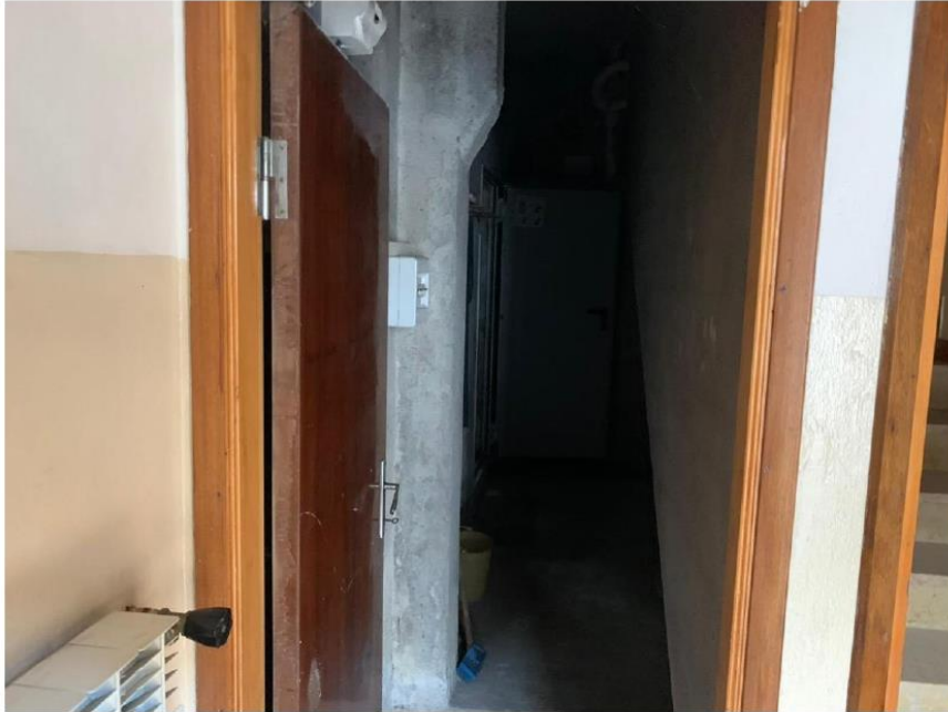
Ripostiglio Piano Terra