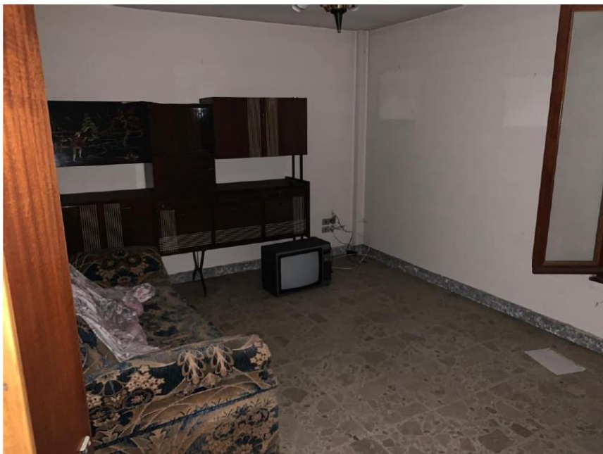
Soggiorno Piano Primo