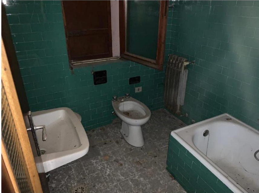
Servizio Piano Primo